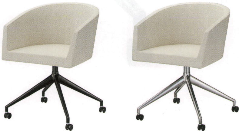
インクイスD (キャスター付) 21622-A D/レザー・フロワ1 脚部：ベースアルミ合金クロ塗装 (キャスター付) 座厚：55 受座：170角150ピッチ ※受座に上下・回転機能は、 付属しません。