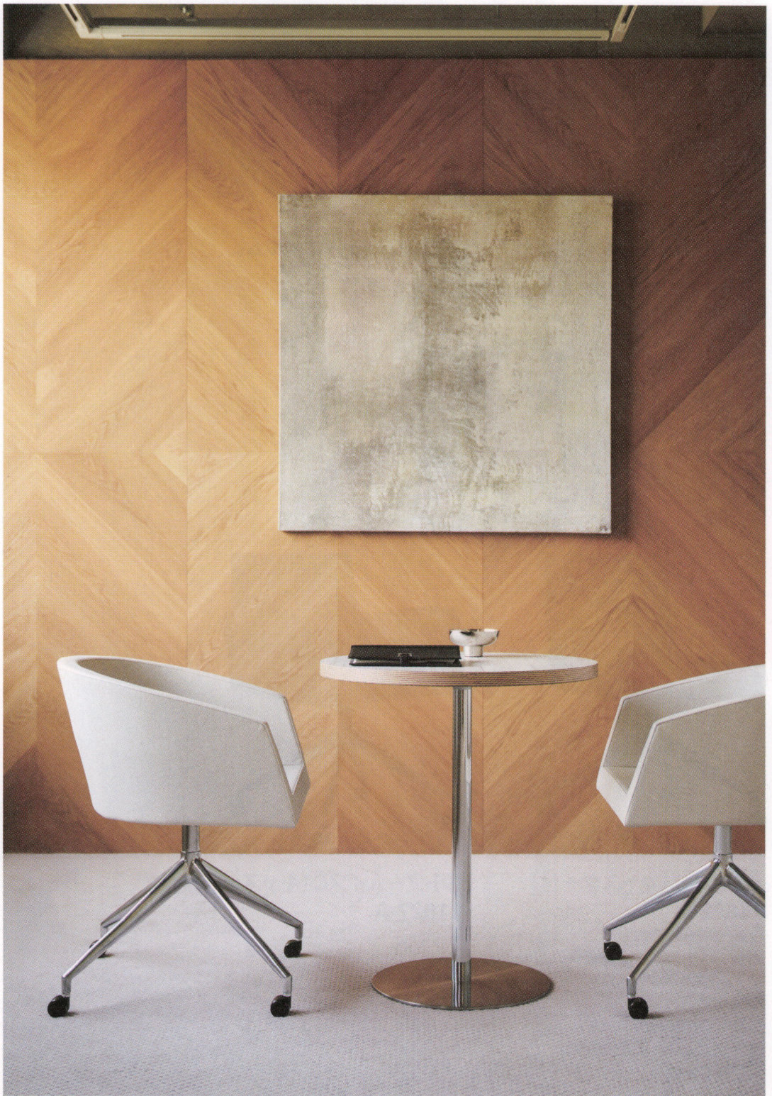
※テーブルST944・AT167 P295・320をご覧ください。

モールドウレタン特有の鋭いエッジと滑らかなカーブ。 商空間からオフィスまで、幅広くお使いいただけます。