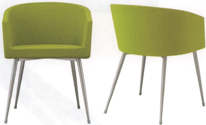
インクイスA-SG 21364-A E/布・パルパ031