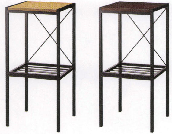
プロットスタンドBL1 21819-E 合板シート ¥42,800

背もたれのない設計に『収納』をプラス。 座面の仕様は、2パターンからお選びいただけます。