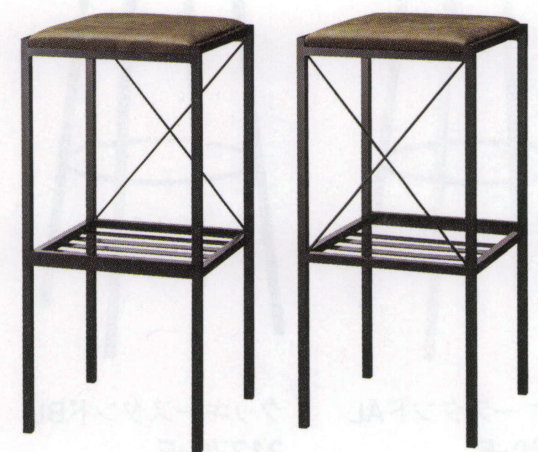
プロットスタンドBL 21821-E D/布・ロモン2