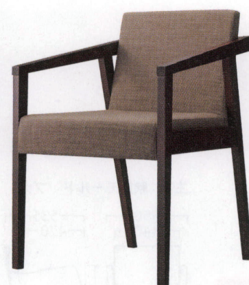
イツソウイスBR 11909-A D/布・エイガT-9204