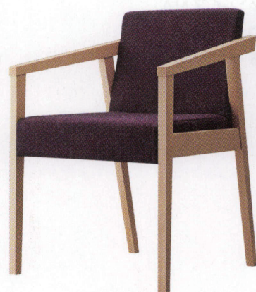
イツソウイスNA 11908-A F/布・ラット2010