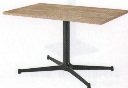
ST944 (OK) -M・ET611-A W1200・D750 天板 ¥59,200 脚部 ¥48,400 ベース:アルミ合金クロ塗装・AJ付 ポール:クロ塗装 (組立式)

反り止め金具 87003-X パイプ40×20・クロ塗装 1本 ¥6,400 (天板W1800用まで同値) ※W方向に取付けます。 ※天板と合わせてのご注文以外は、配送料を別途ご負担いただきます。