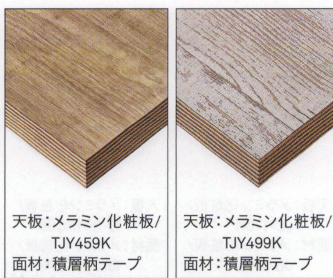
天板:メラミン化粧板/ TJK459K 面材:積層柄テープ