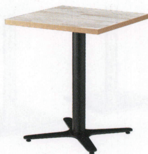
ST944 (PA) -E・FT725-E W600・D600 天板 ¥23,000 脚部 ¥28,200 ベース:アルミ合金クロ塗装・AJ付 ポール:クロ塗装 (組立式)