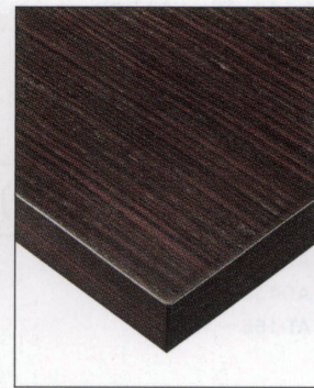
KT-780・781 (RS) 天板: 突板/人工ローズ楳目 面材: 突板/人工ローズ楳目