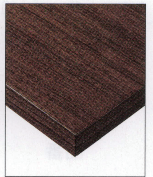
KT-780・781 (WA) 天板: 突板/ウォールナット板目 面材: 突板/ウォールナット