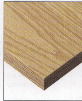
KT-780・781 (OK) 天板: 突板/オーク板目 面材: 突板/オーク