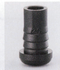
プラパートG 87009-X ¥200 サイズ: 19.1φ×6.5 15.9φ×6.5 底部: 硬質タイル 適床材: 硬質タイル