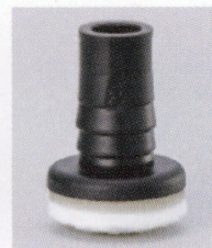
プラパートE 87007-X ¥350 サイズ: 24.6φ×10 (19.1φ用) 21.4φ×10 (15.9φ用) 底部: フェルト 適床材: フローリング