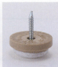
プラパートC 87697-X ¥250 サイズ: 21φ×9 底部: フェルト 適床材: フローリング