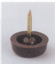
プラパートA 87695-X ¥150 サイズ: 21φ×8

プラパートは、床材により摩耗します。床材の仕様を考慮の上、お選びください。 ※1個あたりの価格です。