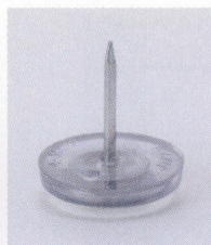
プラパートB 87696-X ¥200 サイズ: 21φ×6