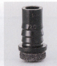
プラパートF 87008-X ¥250 サイズ: 19.1φ×9 15.9φ×9 底部: フェルト 適床材: フローリング